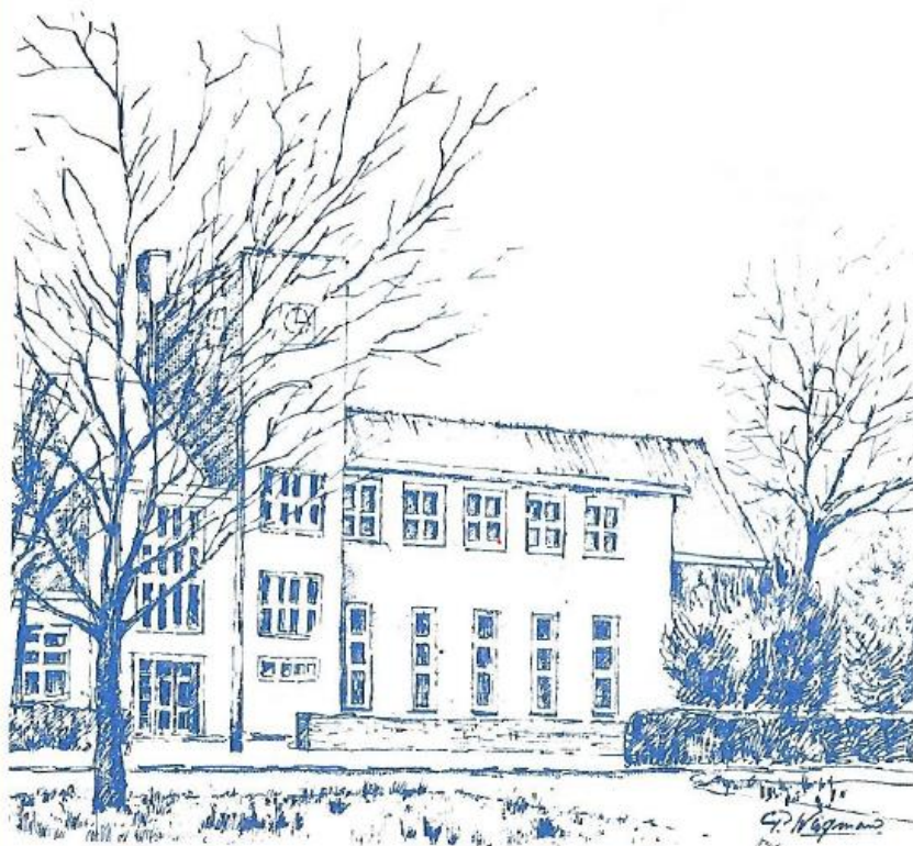
Het "geboortehuis" van GSV-Heemstede: De gymzaal van de voormalige Dreefschool.